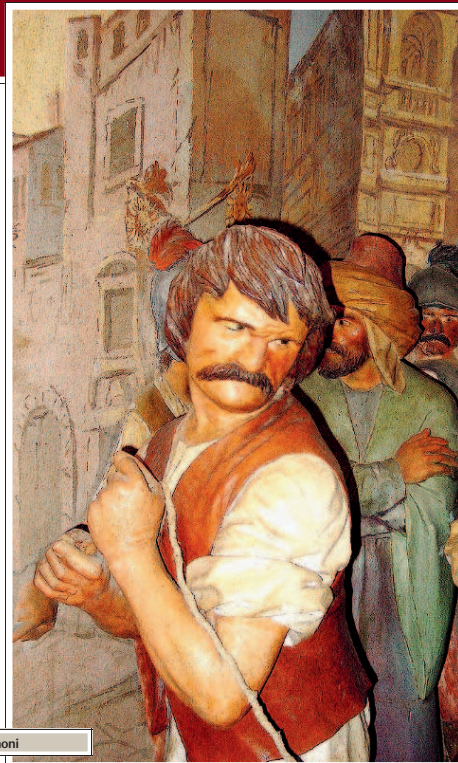
Una delle statue della Via Crucis dei Simoni

Martedì prossimo anteprima per «L'Ultima salita», il film dedicato alla celebre opera dello scultore Beniamino Simoni